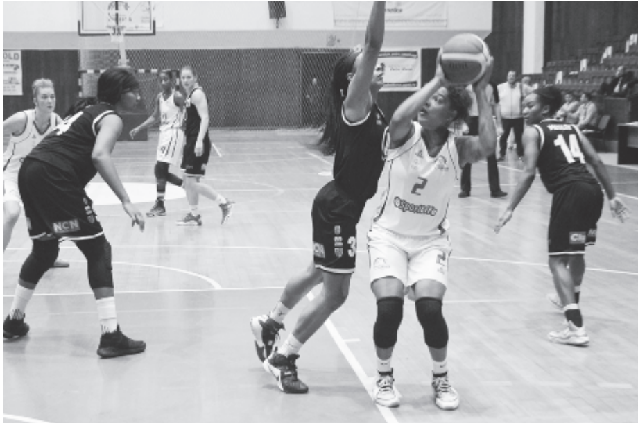
A szenzációszámba menő siker egy hihetetlenül fordulatossá, izgalmas, hollywoodi forgatókönyvről való mérközésen született meg.