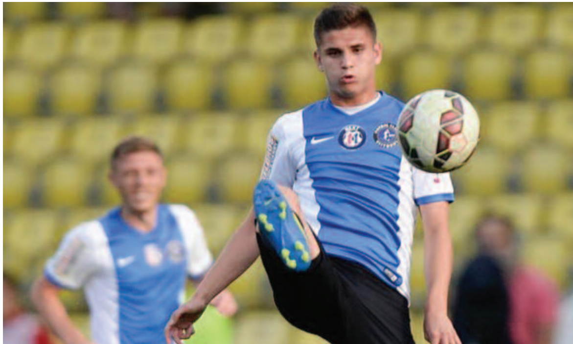
A nyáron az AS Roma, az ősszel a Juventus is érdeklődött a Hagi-csapat legkelendőbb játékosa iránt

* 6 büntetőpont levonva ** 14 büntetőpont levonva