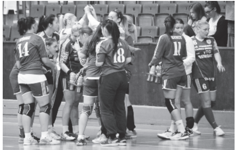
A marosvásárhelyi csapat igazi erőpróbái még hátravannak.

A női kézilabda A osztályban a két csoport győztese közvetlenül jut a Szuperligába, míg a 2. és 3. helyezettek pótszelejtező vívására jogosultak. A Mureșul legalább e pótszelejtezőre továbbra is versenyben marad.